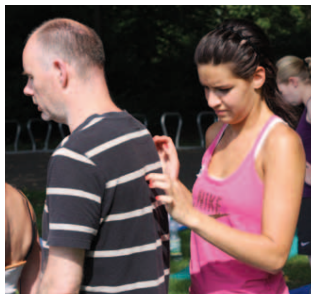
Druckpunkte zur Verbesserung der Rückenwahrnehmung

So werden die Inhalte der Neuen Rückenschule in einem Kurssystem aus Einführungskurs und sich daran anschließenden Aufbaukursen angeboten.