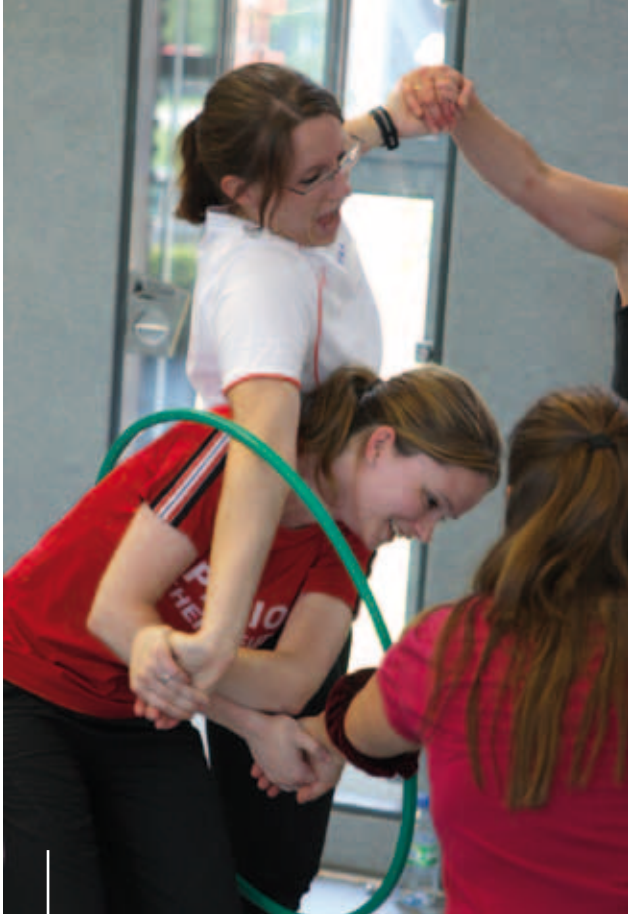
Bewegungsfreude, Gruppendynamik und Beweglichkeit im „Beweglichen Kreis“

reich und vielfältig“ (keine Angst vor falschen Bewegungen), „Es gibt nicht die einzig richtige Haltung!“ (keine Angst vor falschem Sitzen und falschen Haltungen) oder „Rückenschmerzen lassen sich beeinflussen!“ (keine Angst vor Hilflosigkeit).