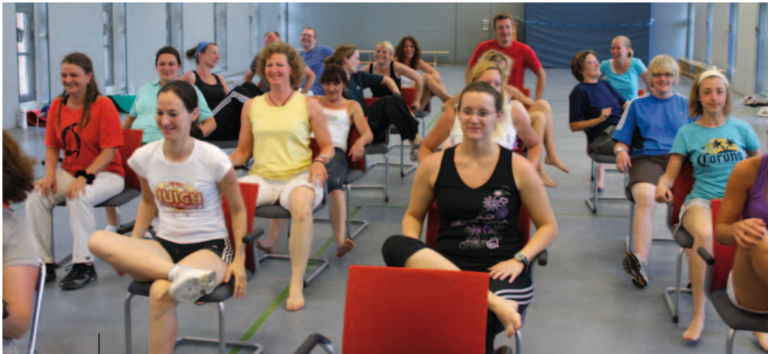
Dynamisches, variables Sitzen in einer Gruppenchoreografie

Der Kursleiter ist nicht mehr an ein starres Programm gebunden, das fast minutiös die Inhalte vorgibt, die er dem Teilnehmer zu vermitteln hat. Er kann daher – selbst bei einem geplanten 10-stündigem Kursprogramm – in erheblich höherem Maße situativ und kreativ auf die Erwartungen, Wünsche und Voraussetzungen der Teilnehmer eingehen. Dies führt, im Sinne eines Abgleichs von Erwartungen und Erfahrungen, zu größeren Erfolgserlebnissen der Teilnehmer.