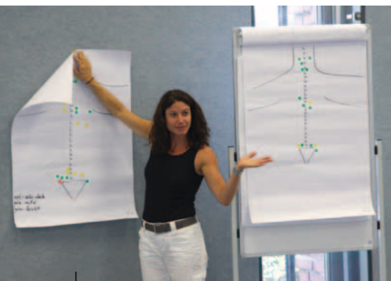
Erfolgskontrolle durch eine Befindensabfrage vorher – nachher mit Hilfe eines Schmerzplakates

In der Neuen Rückenschule hat sich auch das Bild des Rückenschullehrers verändert. Spätestens durch den von der Ottawa-Charta for Health Promotion der WHO 1986 initiierten Paradigmenwechsel, der auf ein höheres Maß an Selbstbestimmung und Selbstbefähigung abzielt, wird klar, dass die Prinzipien der traditionellen Gesundheitserziehung durch teilnehmerorientierte Ansätze zu erweitern sind. Der Kursleiter als Rückenexperte sieht den Teilnehmer hier gleichberechtigt als selbstbestimmte, mündige Person. Er ist deshalb Experte, Coach, Moderator, Vorbild und professioneller Dienstleister (Kempf 2010).