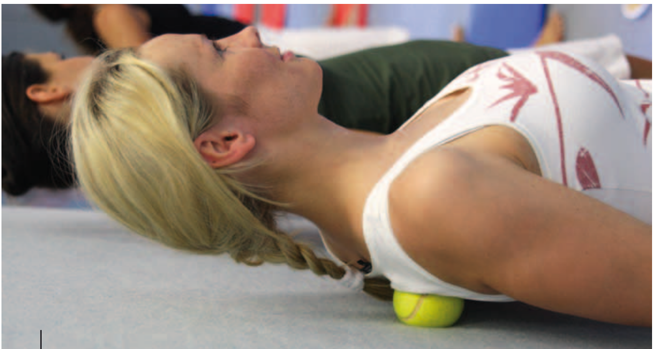
Hilfe zur Selbsthilfe durch eine Triggerpunktmassage.

Diese Botschaften werden durch eine positive, realistische Betrachtungsweise ersetzt, z. B.: „Die meisten Rückenschmerzen sind harmlos!“ (keine Angst vor Rückenschmerzen), „Bewegung ist gut: oft, varianten-