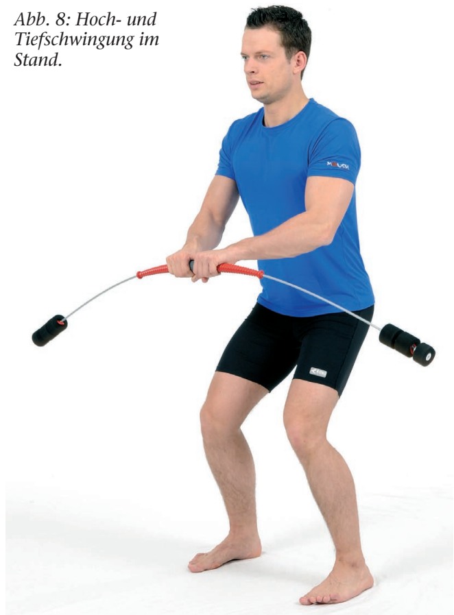
Abb. 8: Hoch- und Tiefschwingung im Stand.