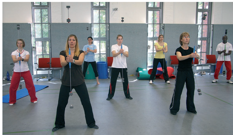
Abb. 1: Propriomed im Kursbetrieb.

den Systemen ist, die Schwingung des Gerätes zu erfassen und sie durch die Impulsgebung der Hände zu unterstützen. Der Teilnehmer sollte - angefangen mit niedrigen Frequenzen und vor allem kleinen Bewegungsausschlägen - lernen, die geeignete Rhythmisierung der Impulsgebung wahrzunehmen. Die Teilnehmer merken in der Regel recht schnell, wenn die „Hände gegen das Propriomed“ arbeiten, oder wenn sie nicht mehr in der Lage sind, den Körper zu stabilisieren.