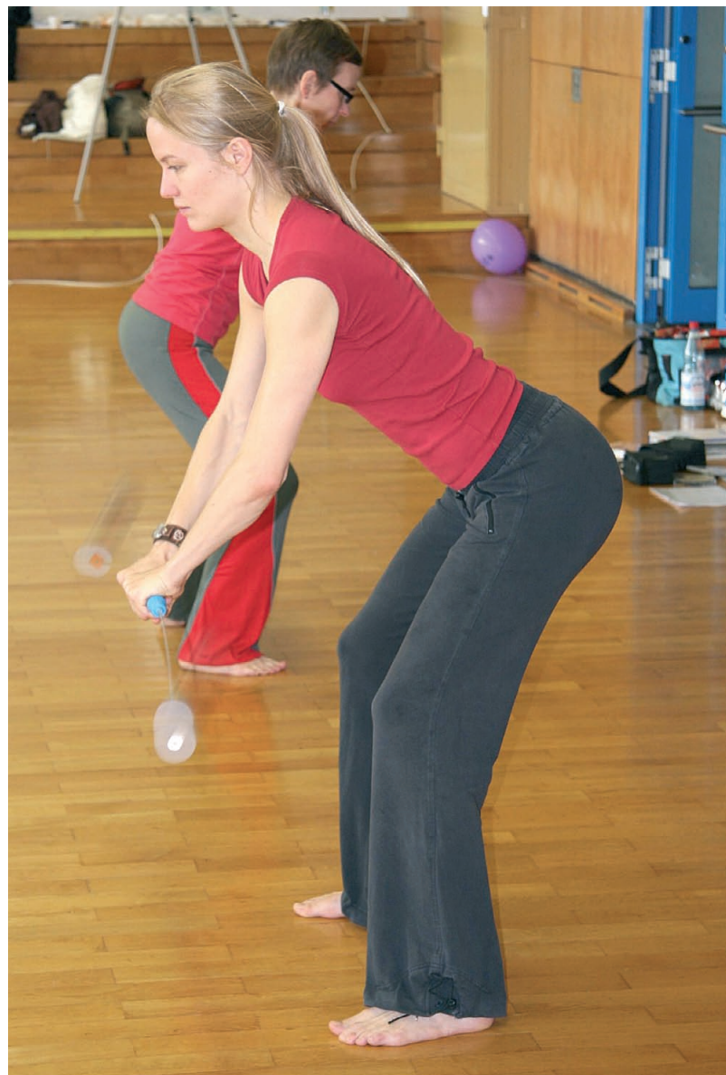
Abb. 5: Schräg nach vorne und unten Schwingen in der Kniebeuge.