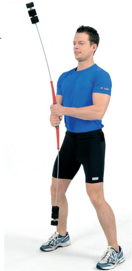
Abb. 2: Vor- und Rück- schwingung.

Übungseinheit die Handposition wechseln. Die Schwingungsamplitude nicht zu groß machen (ca. 30 cm), damit die segmentale Einstellung zugunsten der Gleichgewichtsregulation nicht aufgegeben wird. Bei Einsteigern erst die Grundübung durchführen, bevor die Rotation als Bewegung hinzugefügt wird. Das Becken sollte