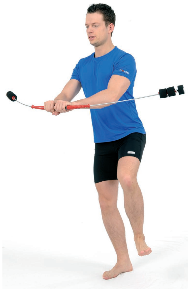
Abb. 7: Vor- und Rückschwingung im Einbeinstand.

dem Körper in Bauchnabelhöhe halten, die Impulsübertragung erfolgt durch kleine Vor- und Rückbewegungen der Hände, die Arme von Brusthöhe in einer halbkreisförmigen Bewegung über den Kopf und wieder zurückführen (Abb. 6).