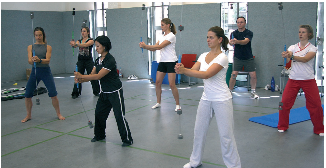
Abb. 3: Vor- und Rückschwingung mit Drehung (in der Rückenschulstunde).

Übungseinheit die Handposition wechseln. Die Schwingungsamplitude nicht zu groß machen (ca. 30 cm), damit die segmentale Einstellung zugunsten der Gleichgewichtsregulation nicht aufgegeben wird. Bei Einsteigern erst die Grundübung durchführen, bevor die Rotation als Bewegung hinzugefügt wird. Das Becken sollte