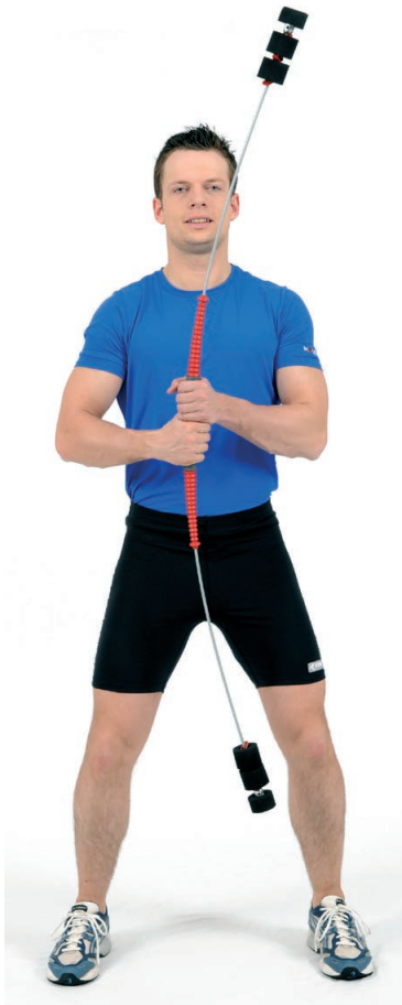
Abb. 4: Rechts- und Linksschwingung.

stabil gehalten werden. Häufig ist allerdings zu beobachten, dass das Becken mitdreht. Hier ist mit den Teilnehmern die Wahrnehmung zu schulen, z.B. durch taktiles Feedback an einer Wand / oder durch den Kursleiter (Hände am Becken).