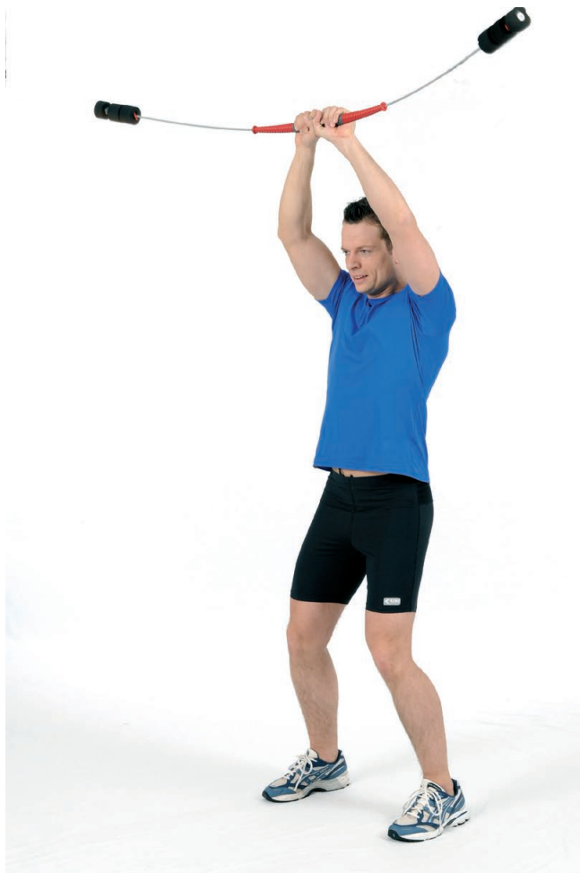
Abb. 6: Vor- und Rückschwingung mit halbkreisförmiger Bewegung der Arme.