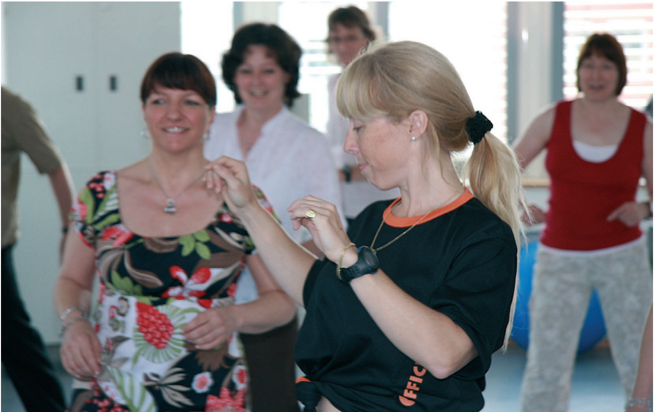
Abb.2: Salsa Bewegungseinheit – „Das Leben genießen“.

Die Rückmeldungen nach insgesamt vier sehr anstrengenden Kurstagen haben uns gezeigt, dass wir mit unserem Weiterbildungsangebot Entspannungsverfahren (Autogenes Training, Tiefenmuskelentspannung) und Stressbewältigung auf dem richtigen Wege sind. Sie ermöglichen nicht nur die Kursdurchführung im Rahmen des §20 durchzuführen, sondern bieten jede Menge Selbsterfahrung und persönliche Weiterentwicklung.