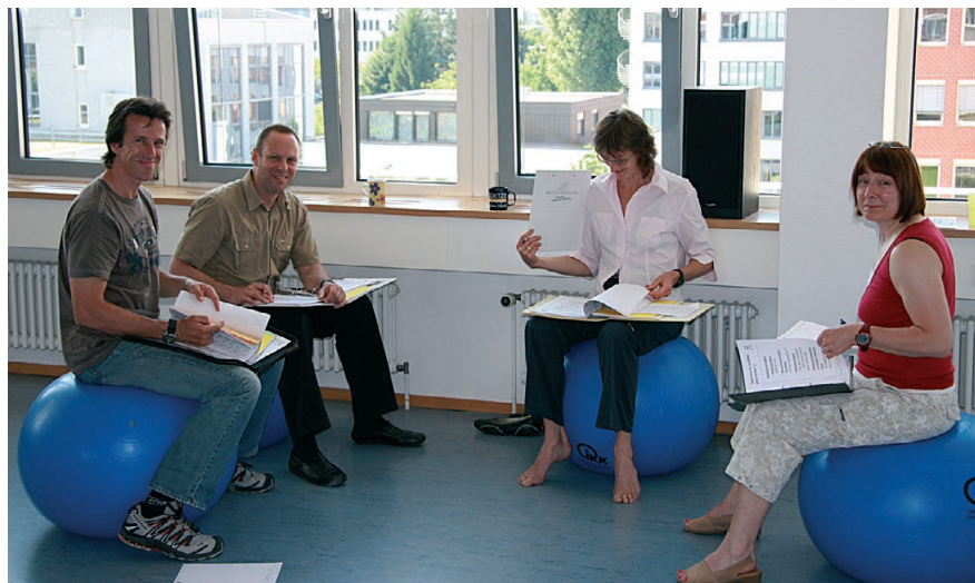
Abb.3: Kleingruppenarbeit „Den Kopf freimachen“.

Die nächste Weiterbildung zum Kursleiter „Stressbewältigung“ ist terminiert auf den 27./28.06. und 11./12.07.2009.