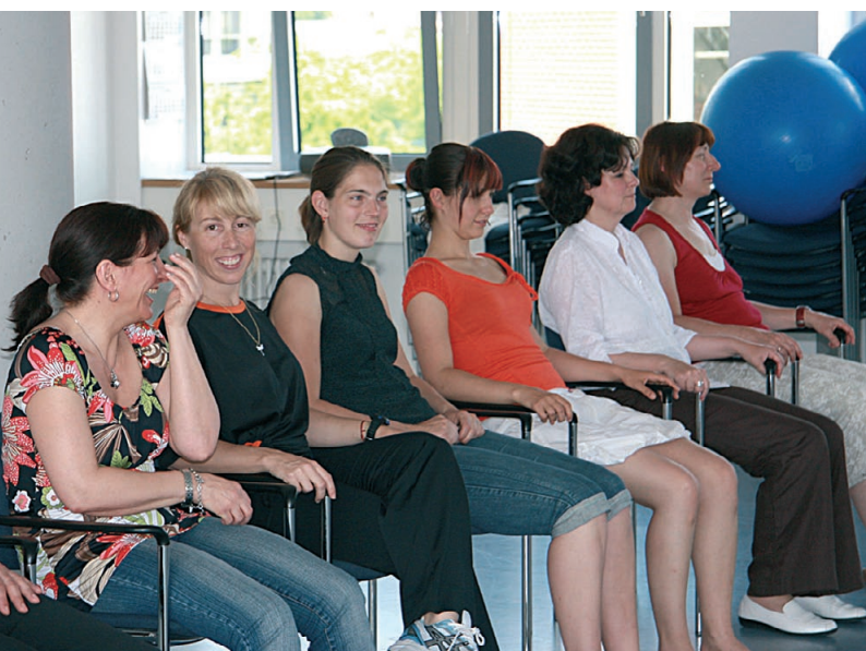
Abb.1: Mentales Kino als Lehrprobeneinheit.

Die für die Planung, Durchführung und Evaluation eines Kurses „Stressbewältigung“ wichtigen Inhalte sind didaktische und methodische Grundlagen, Aufbau und Verlauf einer Übungsstunde, Dauer der jeweiligen Einheiten, dramaturgischer Aufbau, Gestaltung der Übungs- und Trainingssequenzen, Hinweise und Materialien für die Teilnehmer, Übungen für die Teilnehmer zum Transfer der Methoden im Alltag sowie die Arbeit am Auftreten und Verhalten des Kursleiters.